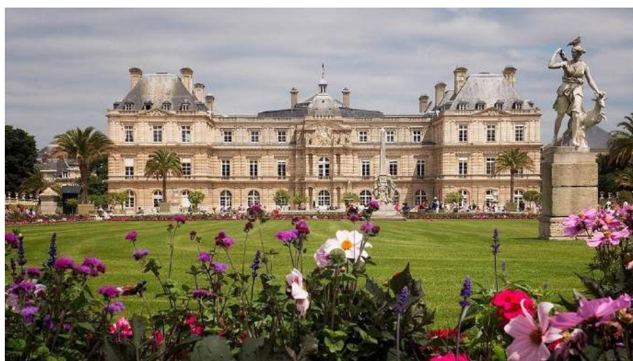
Palazzo Granducale - Lussemburgo