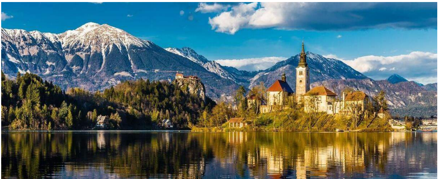
Lago di Bled