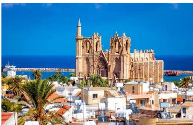
Cattedrale di S.Nicola, Famagosta