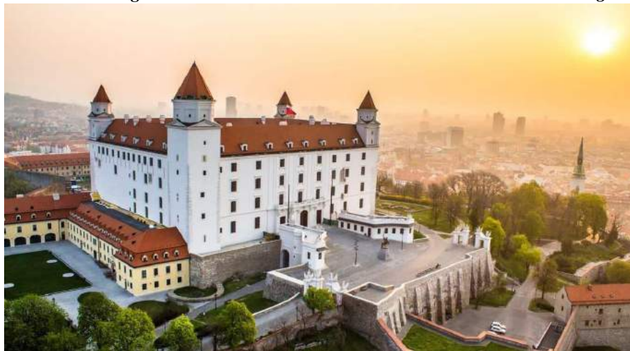
Castello di Bratislava