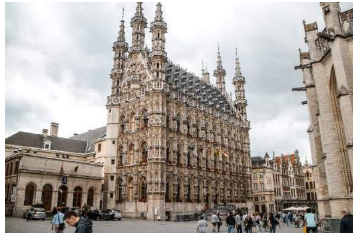
Stadhuis - Lovanio