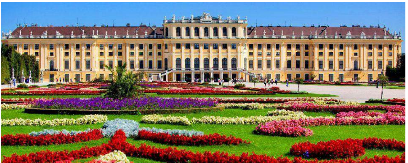
Il palazzo imperiale di Schönbrunn-Vienna