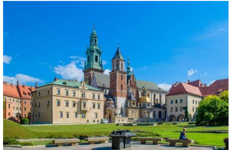
Castello del Wawel – Cracovia