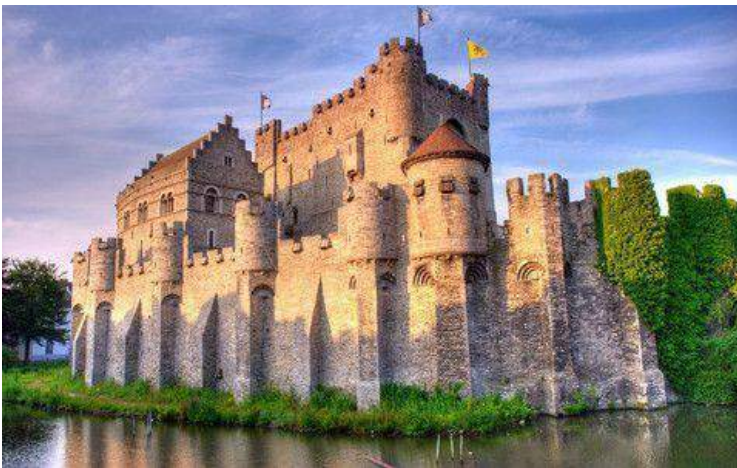
Castello dei Conti di Fiandra - Gand