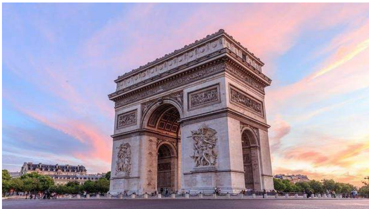
L'arc de Triomphe – Parigi