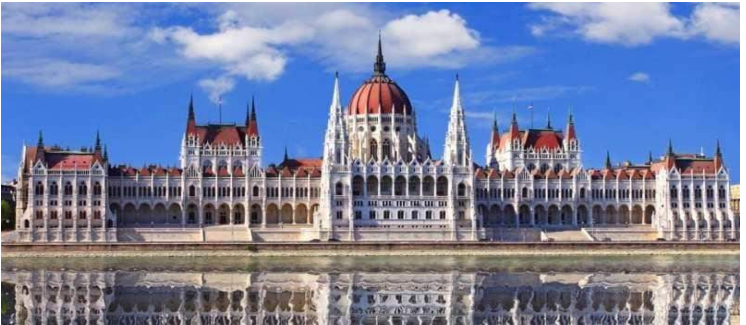
Parlamento di Budapest