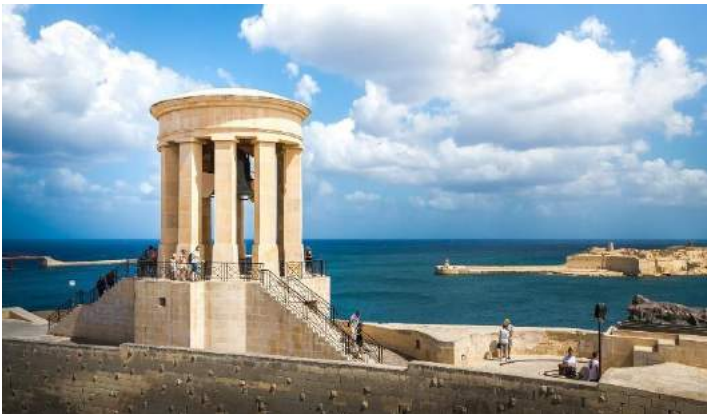
La campana – La Valletta