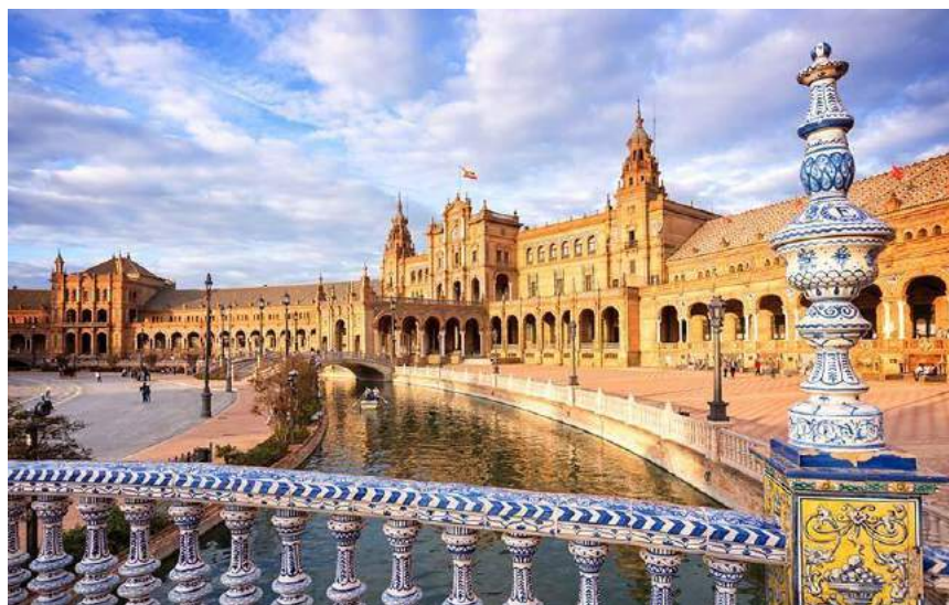
Plaza de España - Siviglia