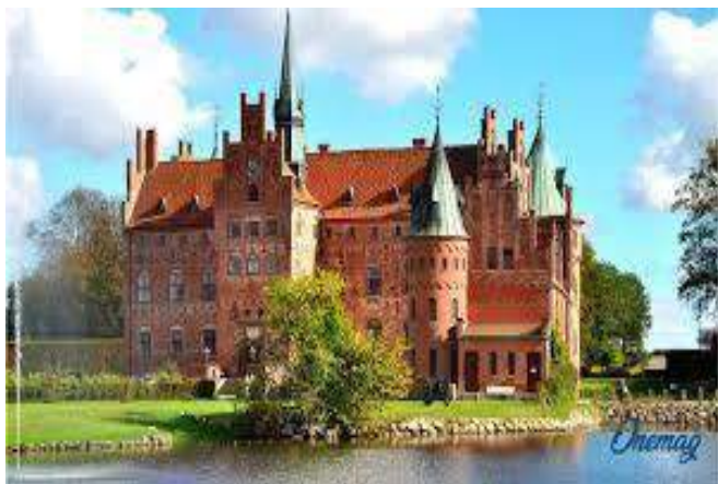
Castello di Egeskov, Odense