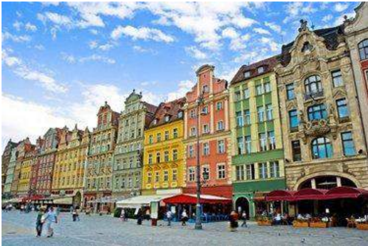
Rynek – Breslavia