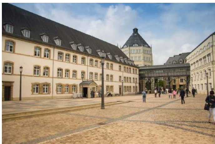
Centro storico - Lussemburgo