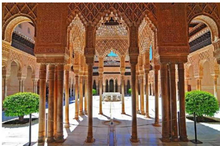
Alhambra – Granada