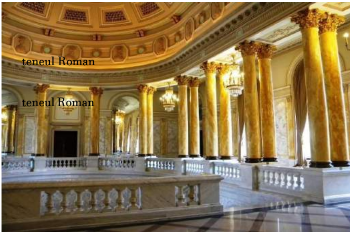
Museo Nazionale d'arte Romena - Bucarest