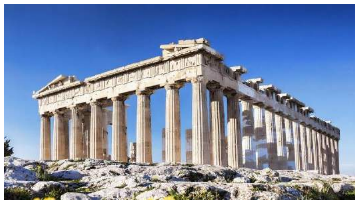
Partenone - Atene