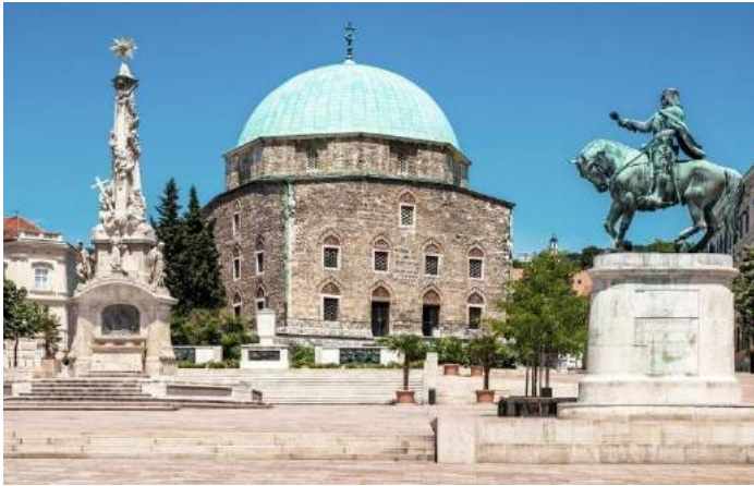
Moschea Gazi Kasim - Pécs