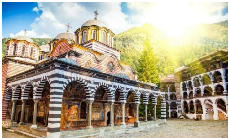
Monastero di Rila