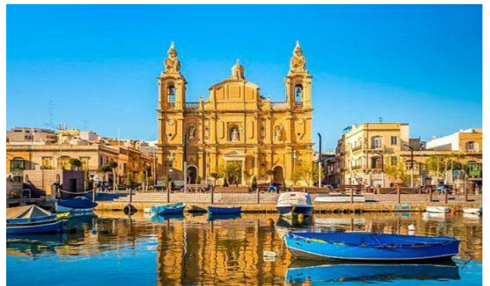
La Baia – Sliema