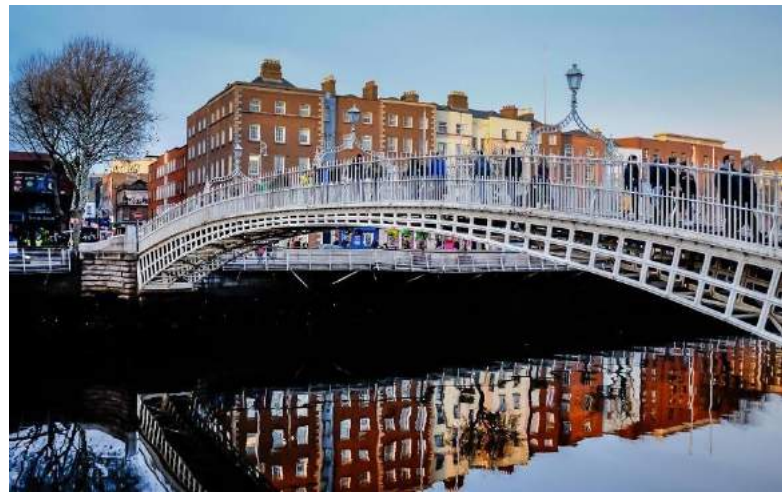
The Ha'penny Bridge - Dublino