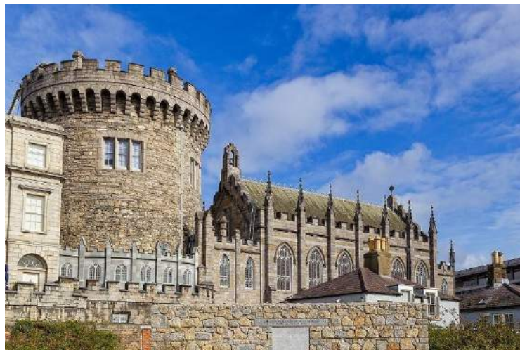
Castello di Dublino