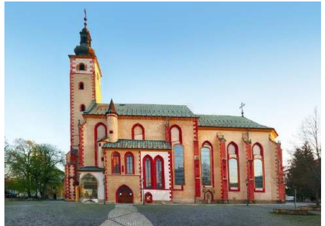
Chiesa dell'Assunzione della Vergina Maria - Banská Bystrica