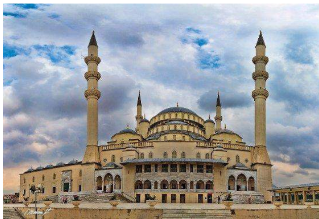
Moschea Kocatepe - Ankara