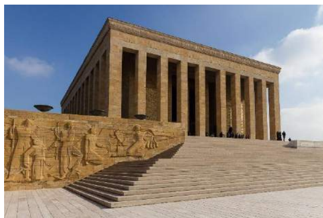
Anitkabir, Mausoleum of Mustafa - Ankara