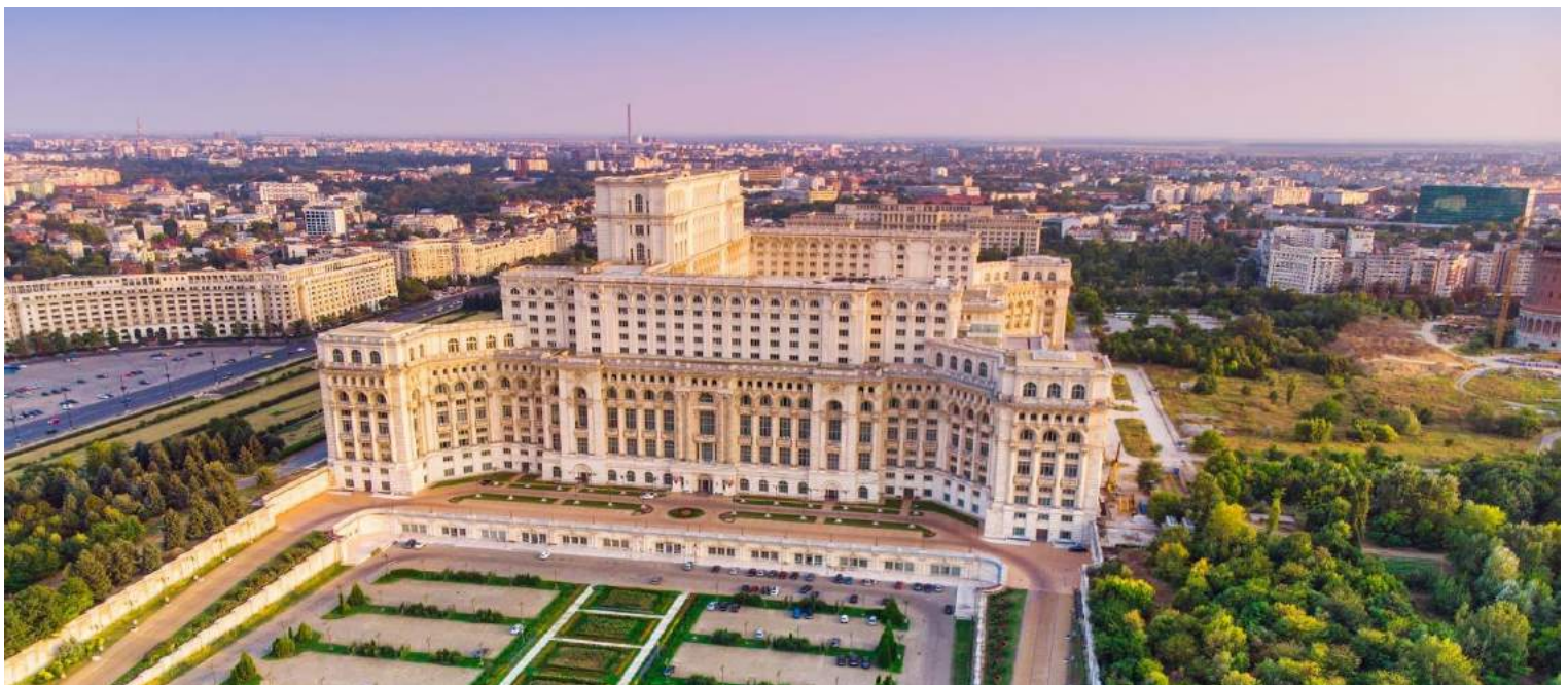
Il Palazzo del Parlamento, Bucarest