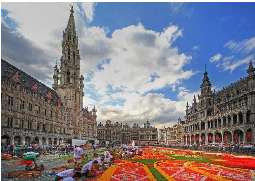
The flower Carpet, Grand Place -Bruxelles.