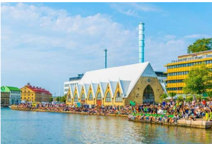
Fish Market – Göteborg