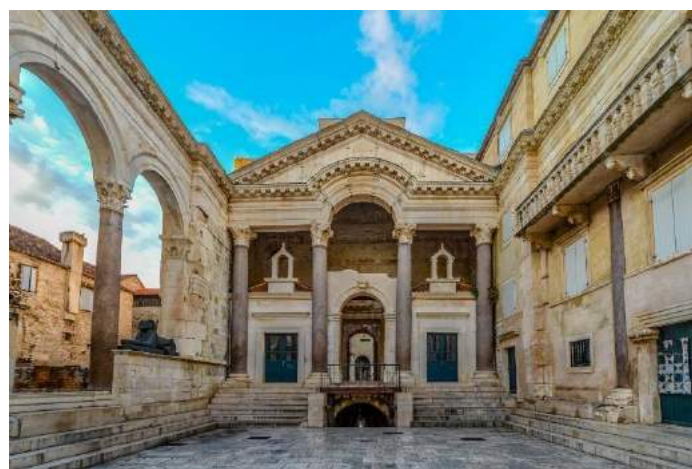
Palazzo di Diocleziano, Spalato