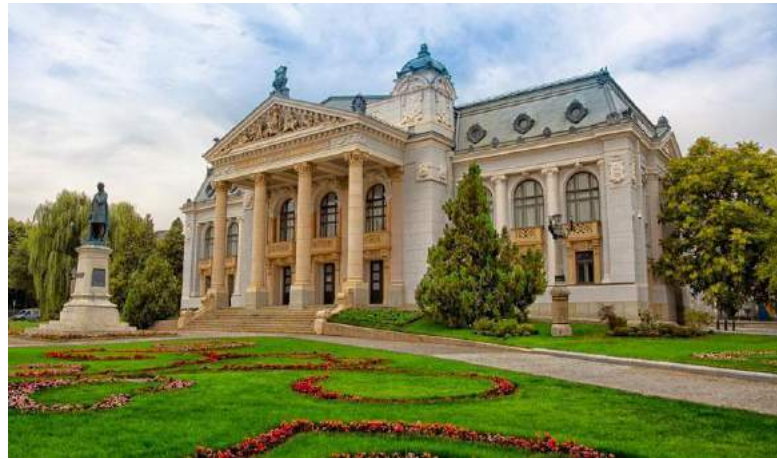
Teatro Nazionale Vasile Alecsandri - Iasi