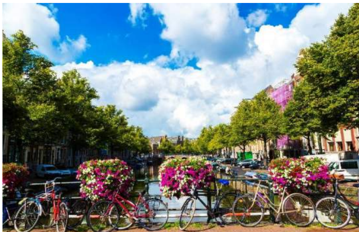
Canale di Amsterdam