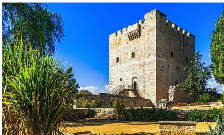
Castello di Limassol