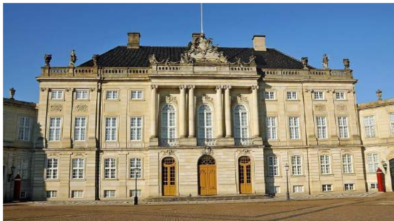
Palazzo di Amalienborg