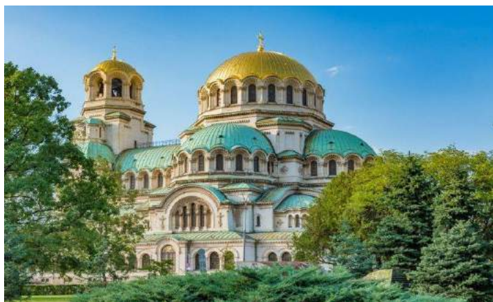
Cattedrale a cupola d'oro di Alexander Nevsky - Sofia