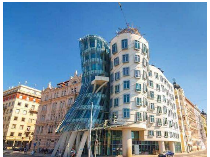
La casa danzante - Praga