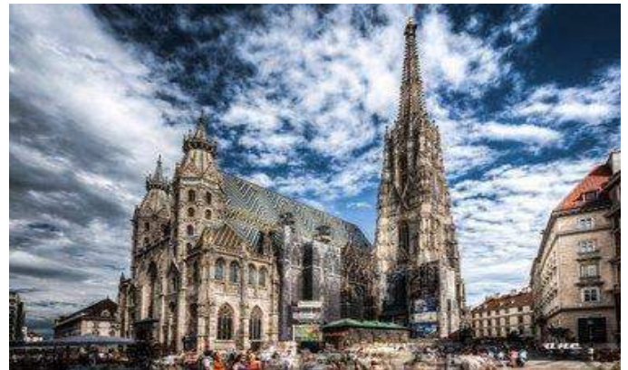
Duomo di Santo Stefano -Vienna