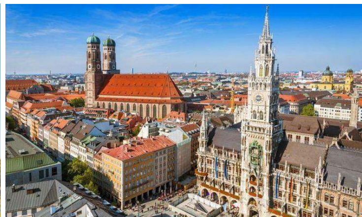
Piazza Principale – Monaco di Baviera