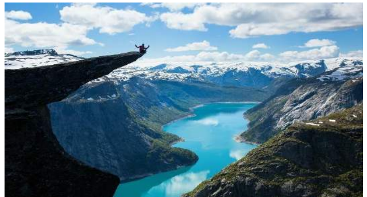
Bergen e i fiordi