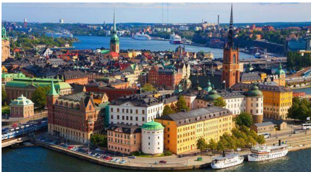
Città di Stoccolma