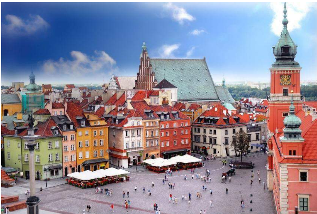
Piazza principale - Varsavia