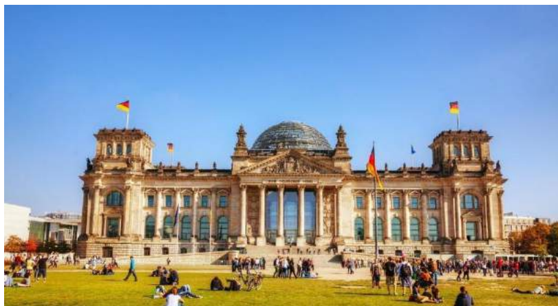
Reichstag - Berlino