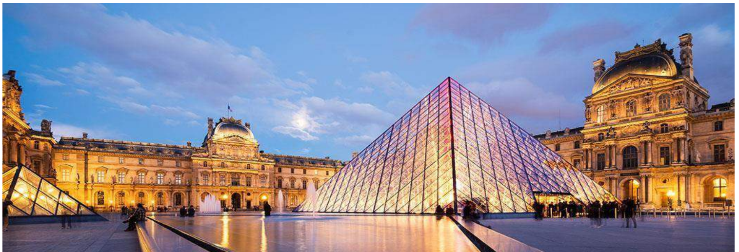
Louvre - Parigi