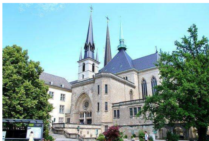
Cattedrale di Notre Dame - Lussemburgo