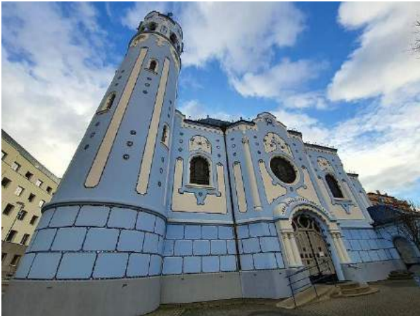
Chiesa blu di Santa Elisabetta d'Ungheria- Bratislava