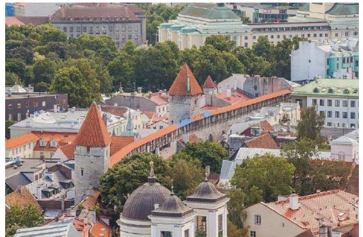
Centro storico – Tallin