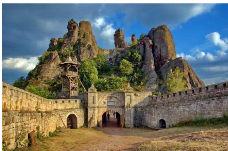
Le rocce di Belogradchik