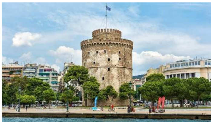
Torre bianca- Salonicco