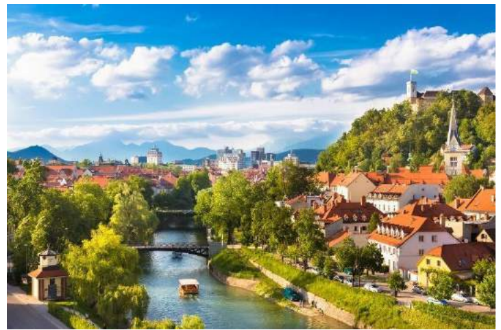
Centro storico - Lubiana