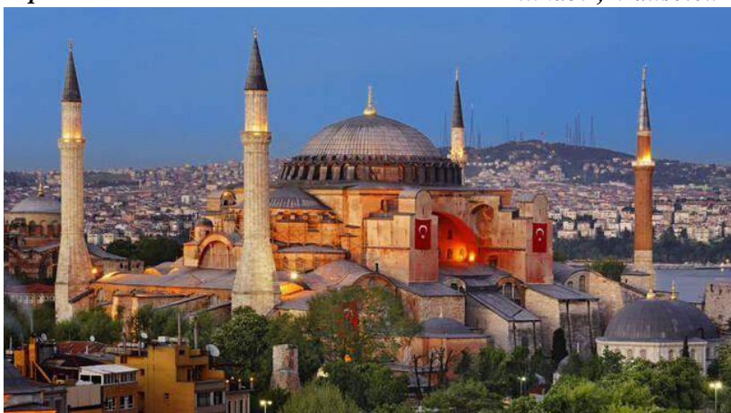
Santa Sofia, Moschea blu – Istanbul