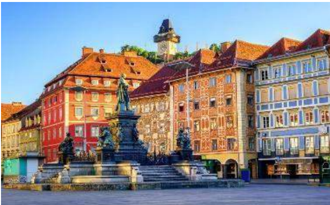
Innenstadt - centro storico di Graz