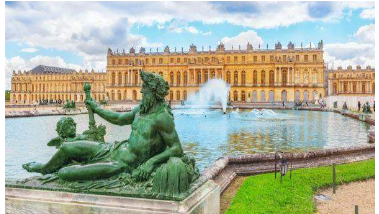
Reggia di Versailles-Parigi