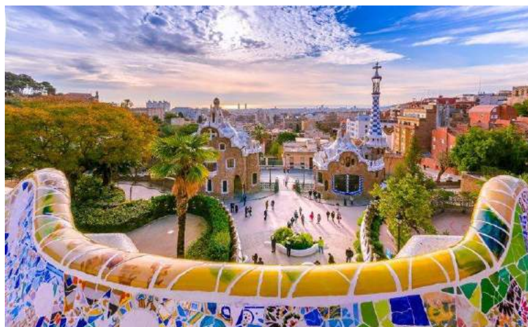
Parc Güell - Barcellona