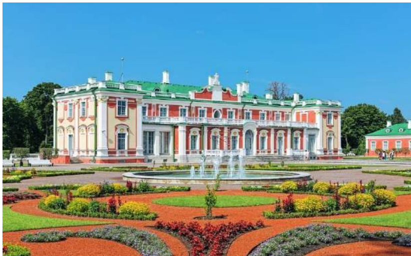
Palazzo Kadriorg - Tallin