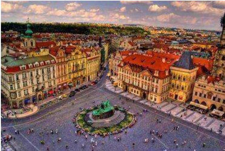
La città Vecchia – Praga