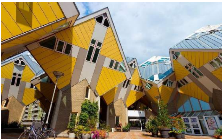
Case cubiche - Rotterdam