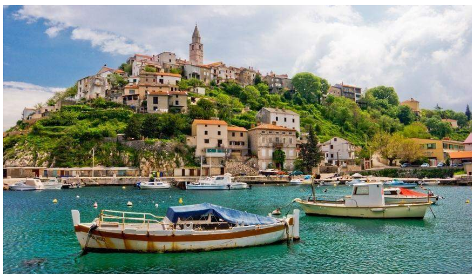
Isola di Krk